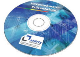
Image- und Produkt-Kommunikation